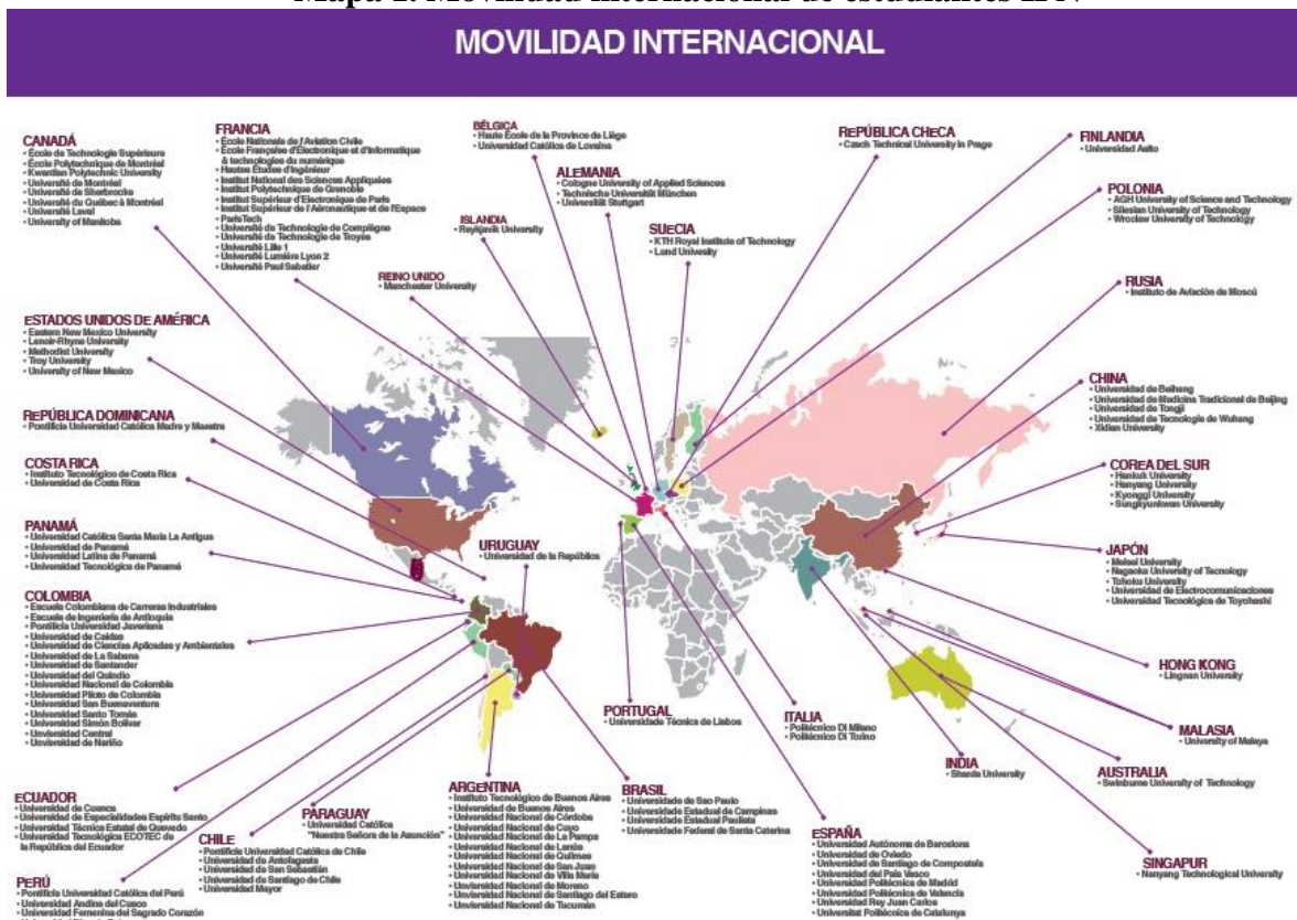
Mapa 1. Movilidad internacional de estudiantes IPN

con instituciones de diversos países en el mundo y, a través de la Coordinación de Cooperación Académica, continúa con su labor de acercamiento con instituciones educativas de otros países, para establecer alianzas estratégicas que se traduzcan en acciones formativas, de investigación y de extensión que contribuyan al proceso de internacionalización, con el objetivo de asegurar la constante mejora en la calidad de sus planes y programas de estudio, en la docencia y en la investigación. Actualmente el IPN mantiene 272 convenios con 189 instituciones en 48 países (IPN, 2015) (Ver mapa 1).